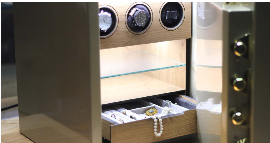
Präzisere Vorgaben, zum Beispiel was die Aufbewahrung von Wertsachen und Bargeld betrifft.

und Bargeld präziser fest. Neu ist explizit auf die anfallenden Gebühren zu achten. Weiter werden die zulässigen Anlagemöglichkeiten entsprechend den unterschiedlichen Bedürfnissen erweitert. Für die mit der Vermögensverwaltung beauftragten Personen und die Betroffenen selber werden die Regelungen besser nachvollziehbar und die Handhabung wird einfacher. ■